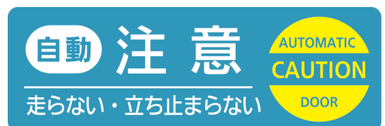
Vタイプ : ADL-Y20V Mタイプ : ADL-Y20M