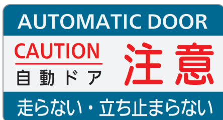
Vタイプ : ADL-Y10V Mタイプ : ADL-Y10M