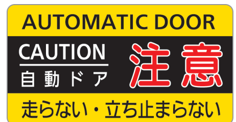
Vタイプ : ADL-Y12V Mタイプ : ADL-Y12M