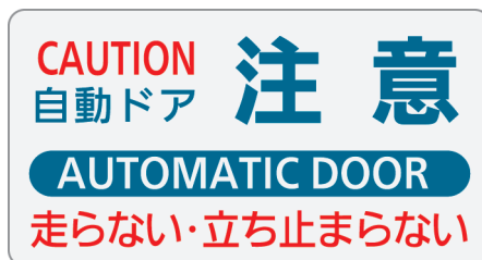
Vタイプ : ADL-Y11V Mタイプ : ADL-Y11M